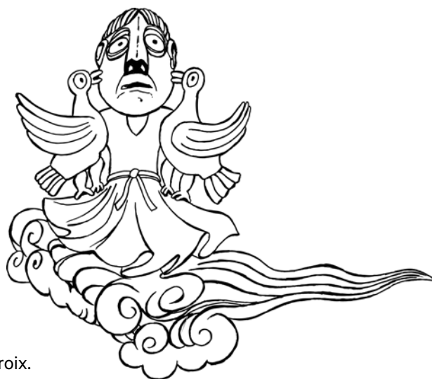
D'après deux chapiteaux : Oiseaux affrontés de part et d'autre d'une tête humaine, ancienne maladrerie Saint-Lazare, Poitiers, XII ème siècle. Personnages parmi des végétaux stylisés, provenant probablement de la collégiale Saint-Hilaire-le Grand de Poitiers, seconde moitié du XI ème siècle. Musée Sainte-Croix.