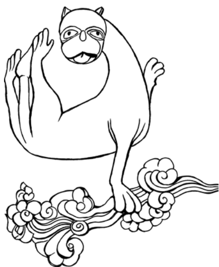
D'après un chapiteau aux lions affrontés, provenant d'une porte de l'ancien prieuré Saint-Nicolas, Poitiers, XI ème siècle. Musée Sainte-Croix.

Jean-Luc Dorchies, Stéphane Duval, commissaires