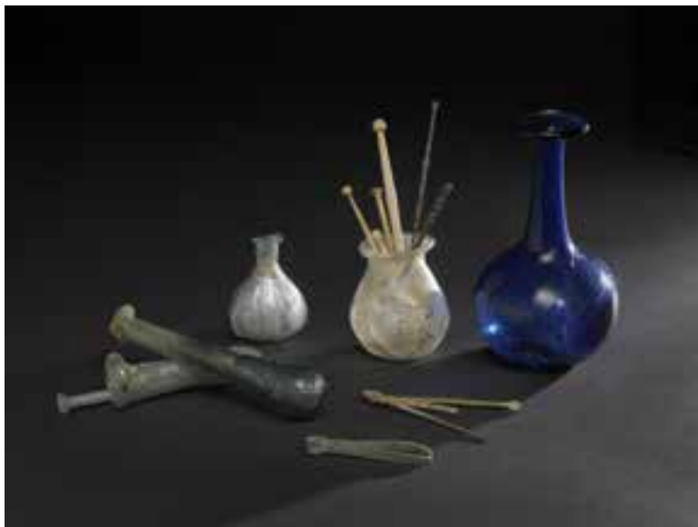
Flacons, balsamiques, pince, épingles... Poitiers et environs (Vienne), époque romaine

de marbre d'Athéna, d'inspiration grecque, née des mains d'un artiste de Rome à l'époque augustéenne, renvoie à l'apogée de la capitale pictonne. La verrerie tient une belle place au sein des collections, issue pour l'essentiel de la nécropole des Dunes.