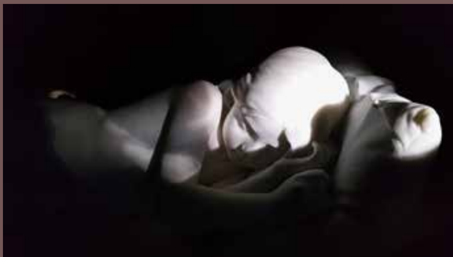
Jean Escoula, Le Sommeil , 1885, détail © Jean-François Magnan