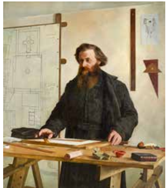
Henri Rondel, Portrait du père Camille de la Croix à sa table de travail, 1883

Ses archives, léguées à sa mort à la Société des Antiquaires de l'Ouest, sont aujourd'hui déposées aux Archives départementales de la Vienne et ont récemment fait l'objet d'un projet de numérisation et de valorisation conduit par le laboratoire HERMA de l'Université de Poitiers.