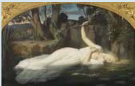
Léopold Burthe, Ophélie , 1852

Tarif : 3 € / gratuit pour les moins de 18 ans et étudiants