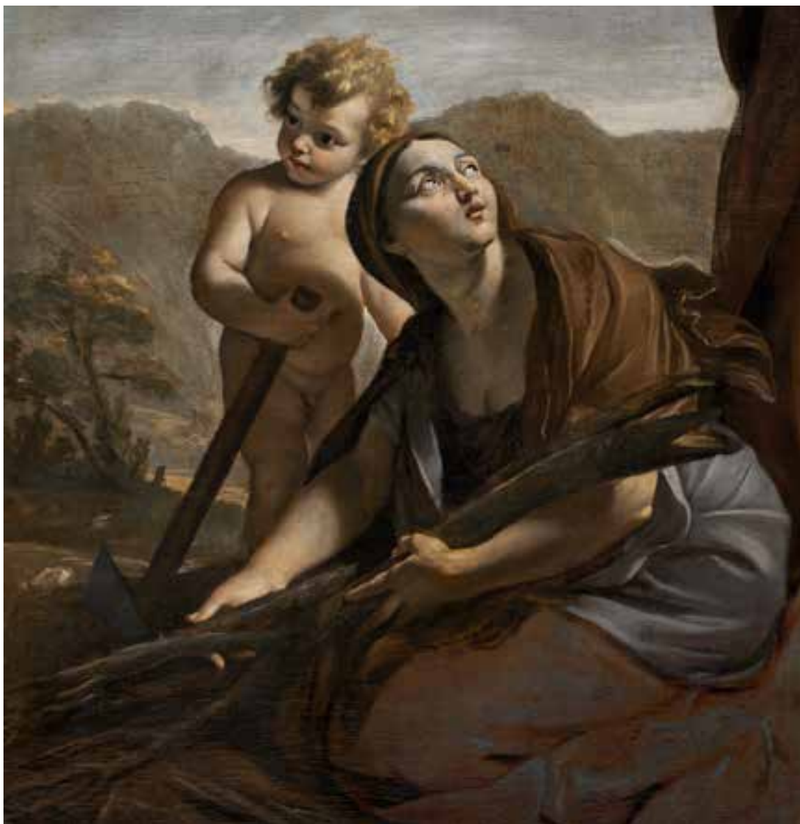
Giovanni LANFRANCO, Élie et la veuve de Sarepta , 1625, (détail)