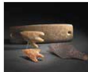
Sépulture de Magné, Gençay (Vienne). Abri de Bellefonds (Vienne). Sépulture de Thorus, Château-Larcher (Vienne) – Chalcolithique

L'œuvre de Gauffier s'inscrit dans le courant néo-classique, nourri par l'héritage de la civilisation gréco-romaine. Réfugié en Italie pendant la Révolution française, l'artiste puise au Grand genre de la mythologie, de la Bible ou de l'histoire antique, avant de se consacrer au paysage.