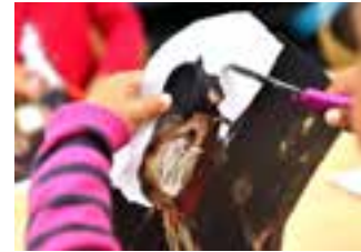
Atelier © SCoussay

Le musée mène des actions de médiation hors-les-murs dans les écoles et leurs garderies, les maisons de quartier, les crèches ou encore auprès des enfants hospitalisés au CHU.