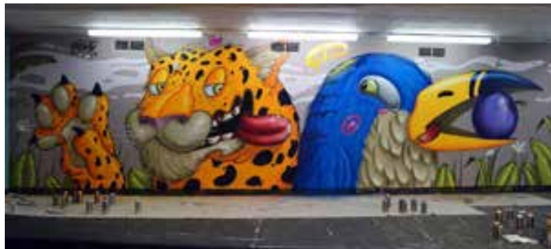
Syrk, peinture murale, Musée Sainte-Croix

Programme des rendez-vous autour de l'exposition à venir.