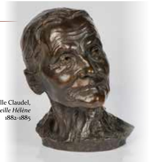
Camille Claudel, La Vieille Hélène 1882-1885

Le Musée Sainte-Croix expose le troisième ensemble le plus important en France - avec 11 sculptures dont la célèbre La Valse - après celui du musée Rodin à Paris et du musée Claudel de Nogent-sur-Seine.