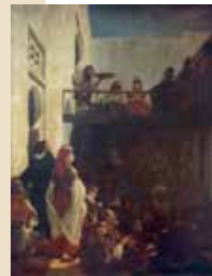
Alfred Dehodencq (1822 – 1882), Une noce juive à Tanger , 1870

La Fête juive, très remarquée au Salon de 1870, peut être considérée comme l'un des chefs-d'œuvre du peintre. Le tableau de grandes dimensions, mis en réserve pendant plus de 15 ans, bénéficie d'une restauration de son imposant cadre. Elle est présentée sur le plateau des Orientalistes.