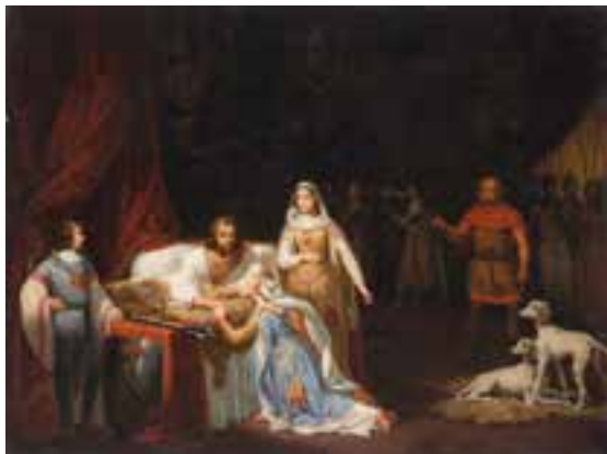
Hippolyte Lecomte, Le Réveil de Richard Cœur de Lion , 1834

Les peintres choisissent de représenter des scènes anecdotiques de la vie des grandes figures historiques plutôt que d'illustrer des événements majeurs de l'Histoire.