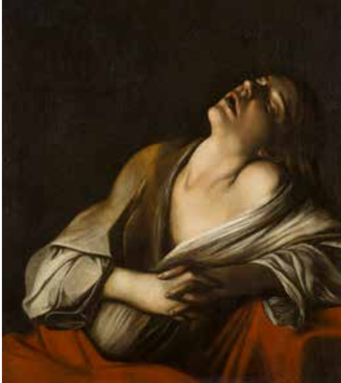
D'après Caravage, Madeleine en extase , 1610-1620

Le parcours chronologique permet la découverte du Trecento (fragments d'un polyptyque italo-byzantin par Paolo Veneziano) ainsi que du Siècle d'Or des écoles du Nord, dont des natures mortes (Ambrosius Bosschaert), des paysages flamands et hollandais (Daniel Seghers, Marten Van Valkenborch, entourage de Brueghel de Velours), des scènes de genre (Téniers le Jeune), des scènes religieuses (Hendrick Bloemaert), de la peinture d'Histoire italienne et française (grands formats de Giovanni Lanfranco et de Jean-Baptiste Marie Pierre).