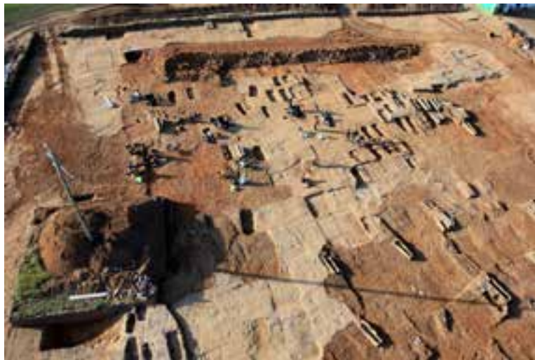
Nécropole médiévale, Luxé Les Sablons, © T. Duquenoix Archéosphère

L'exposition a été initiée par LISEA, COSEA et SNCF RESEAU. Elle a été reconnue d'intérêt national par le ministère de la Culture et bénéficie à ce titre d'un soutien financier exceptionnel de l'État.