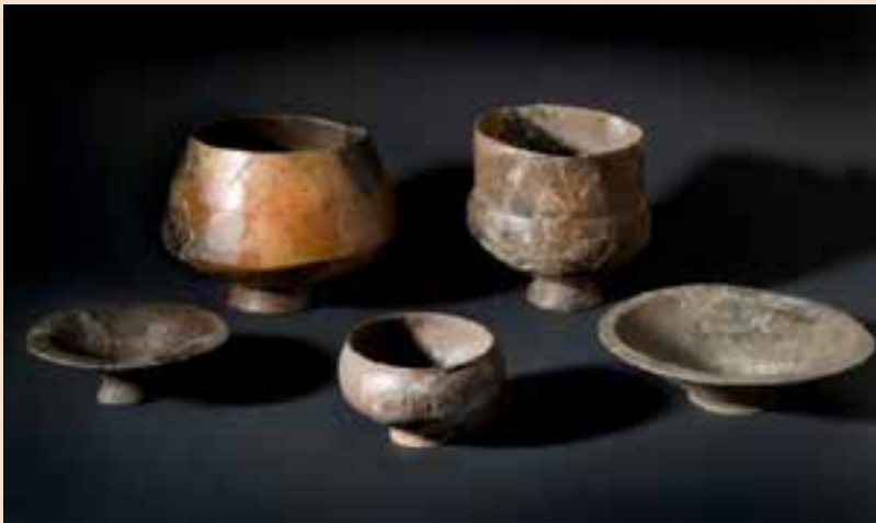
Coupes et vases. Le Camp Allaric, premier Âge du Fer Aslonnes (Vienne)

Cette sépulture féminine datée du milieu du 6 e siècle avant J.-C. fut découverte en 1937 dans une carrière de sable située au lieu-dit « Le Mia » à Aillé, dans la commune de Saint-Georges-Lès-Baillargeaux. Elle a livré une parure exceptionnelle dont un torque massif, quatre bracelets, un brassard composite, constituant un ensemble unique et remarquable.