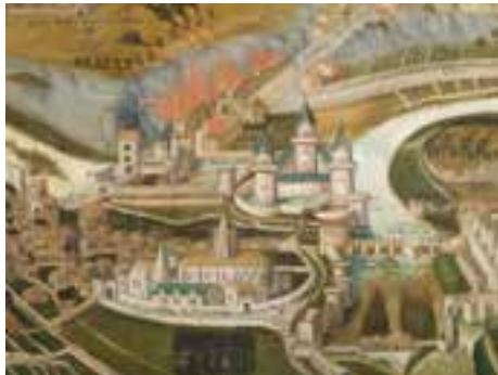
François Nautré, Le Siège de Poitiers 1619, détail