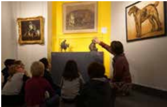
Avec l'école

Les ateliers d'expression plastique offrent aussi aux élèves la possibilité de développer leur pratique artistique. Ces ateliers sont un prolongement de la découverte des collections et permettent de garder une trace hors du musée.