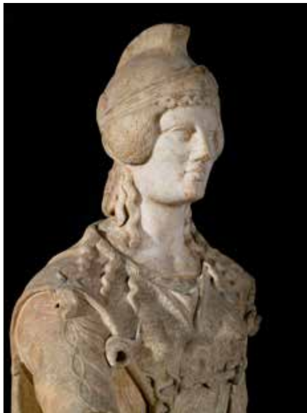
Athéna, Poitiers (Vienne), 1 ER s.