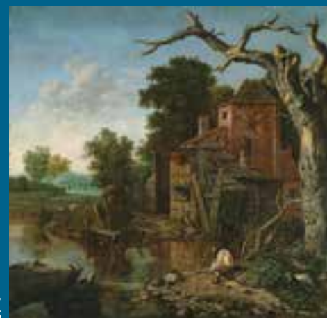
Jan Wijnants, Paysage à la mare , 1675

Un espace muséographique leur est consacré dans le parcours du musée.