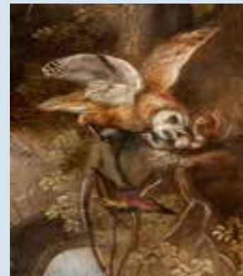
Attr. Van Kessel Jan, L'Allégorie de la Nuit , 16 e -17 e s., détail