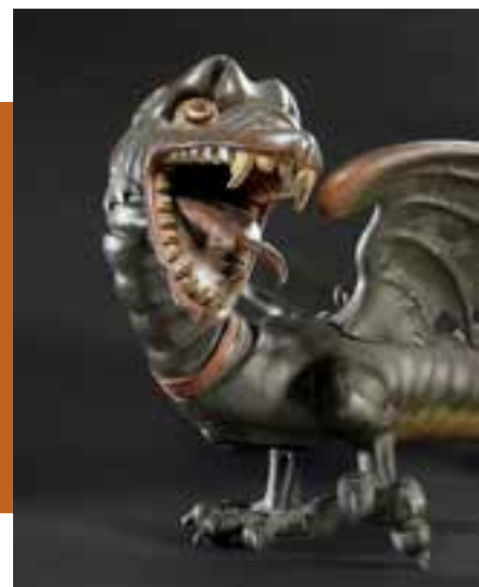
Jean Gargot, La Grand'Goule , 1677 Bois polychrome

L'effigie de la Grand'Goule, monstre effrayant, rappelle les grandes heures de la ville de Poitiers, et notamment la Légende dorée de sainte Radegonde, fondatrice de l'abbaye Sainte-Croix, patronne de Poitiers vénérée dans toute la région.