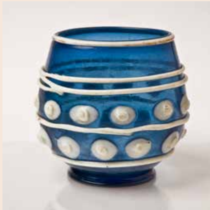
Vase-reliquaire, verre soufflé à décor rapporté, 11 e siècle Abbaye de Saint-Savin-sur-Gartempe (Vienne)

Les collections présentent des inscriptions et des œuvres sculptées, héritées d'édifices parfois disparus. Le chapiteau de La Dispute, œuvre majeure de l'art roman, proviendrait quant à lui du pilier de justice du bourg Saint-Hilaire. Parmi les arts du feu, le vase-reliquaire de l'abbaye de Saint-Savin est un rarissime témoin d'une production de verres bleus de prestige soufflés au 11 e siècle, dans un atelier encore inconnu d'Europe occidentale.