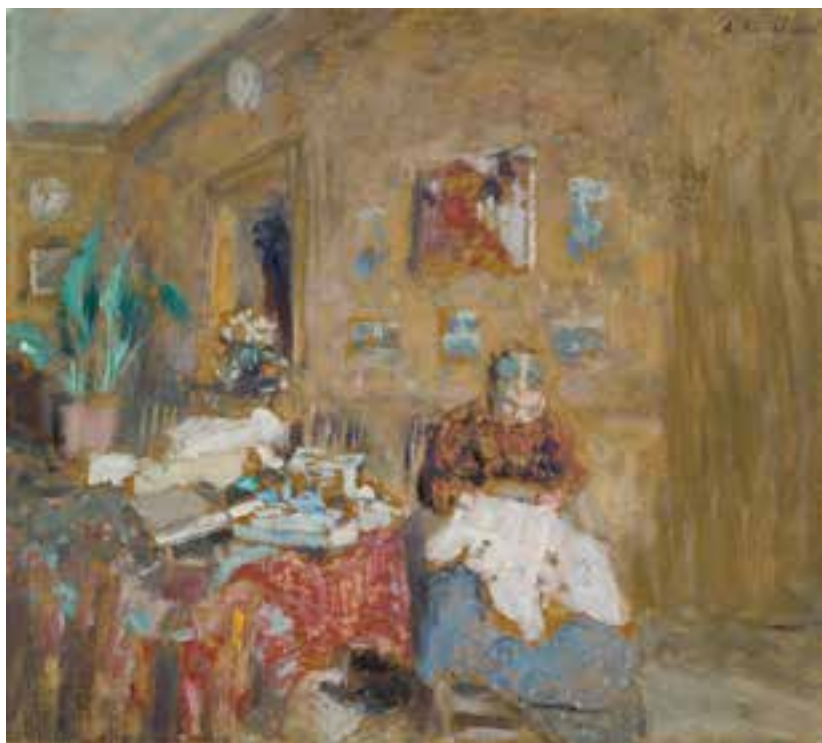
Édouard Vuillard, La Couture , v. 1902

Les écritures figuratives singulières vont de la verve d'Alfred Courmes aux galeries de portraits mondains de Romaine Brooks, en camaïeux de gris et de Sarah Lipska, à la rudesse primitiviste.