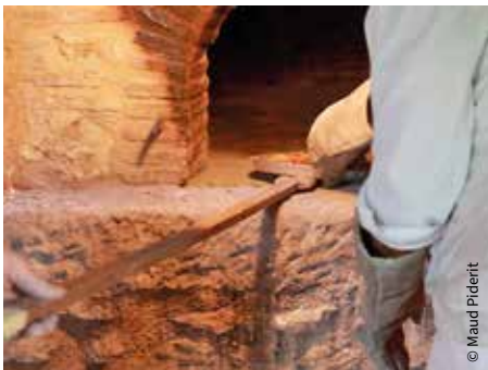
Le four à pain du Breuil-Mingot / Poitiers