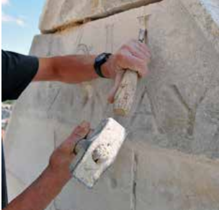
Le savoir-faire de la taille de pierre