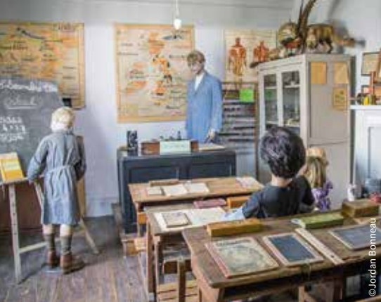
La maison d'autrefois / Chasseneuil-du-Poitou