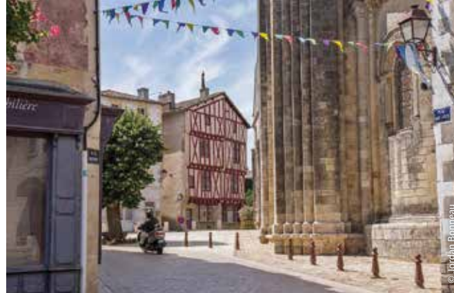
Le centre historique de Lusignan