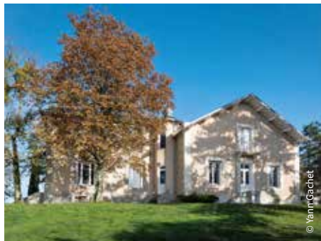
La Villa Bloch / Poitiers