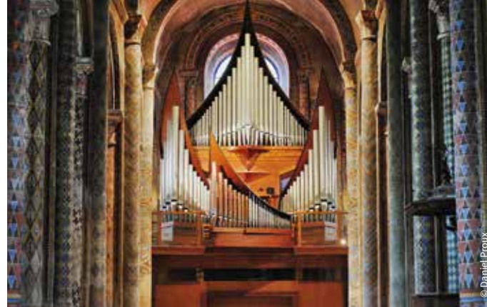
Le grand orgue de Notre-Dame-la-Grande / Poitiers