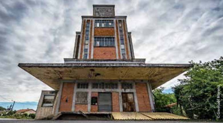
Le silo à grain / Saint-Julien-l'Ars