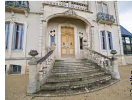
La maison Xavier Bernard / Saint-Sauvant