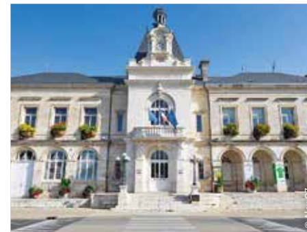
L'hôtel de ville / Chauvigny