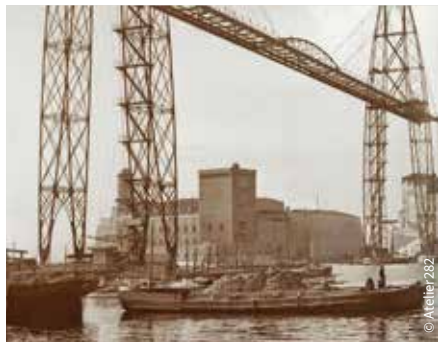
Photographies sur plaque de verre / exposition à la Maison de l'Architecture de Poitiers en Nouvelle-Aquitaine