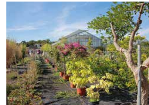
Les serres de Beauvoir / Vouneuil-sous-Biard