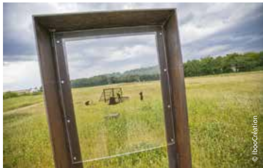
Le sentier d'interprétation des bas-fourneaux / Mignaloux-Beauvoir