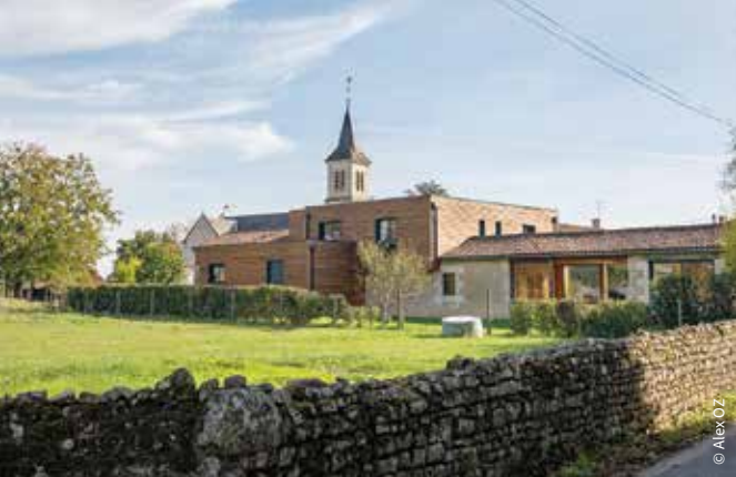
Le bourg de Savigny-l'Évescault