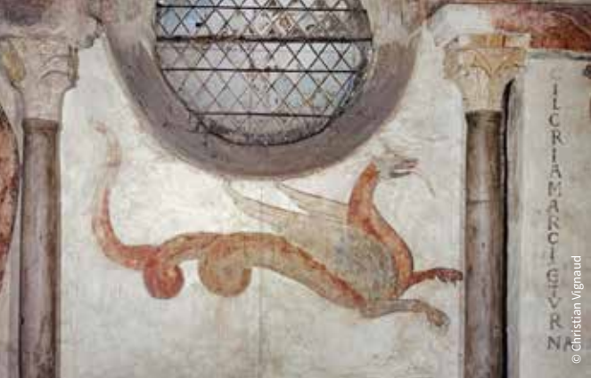
Le dragon, peinture murale du baptistère Saint-Jean / Poitiers