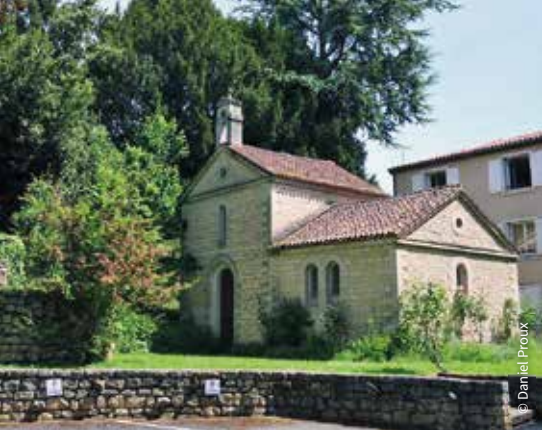
La cellule de sainte Radegonde / Poitiers