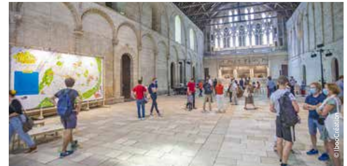
La salle des Pas Perdus, Palais / Poitiers