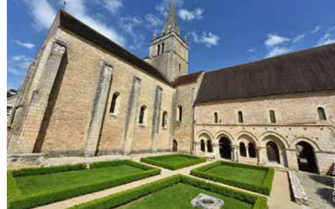
L'abbaye de Saint-Benoît