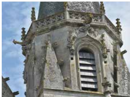
L'abbaye Saint-Martin / Ligugé