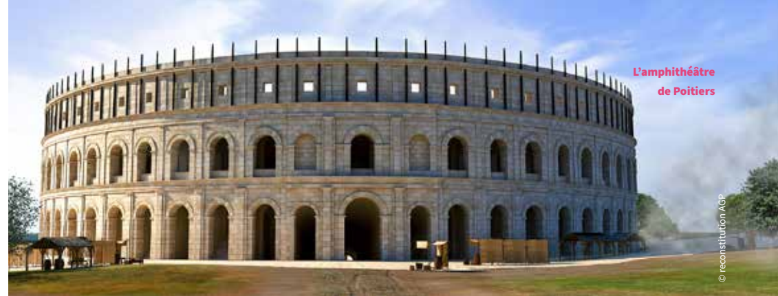
L'amphithéâtre de Poitiers