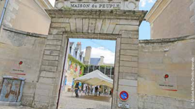
La Maison du Peuple / Poitiers