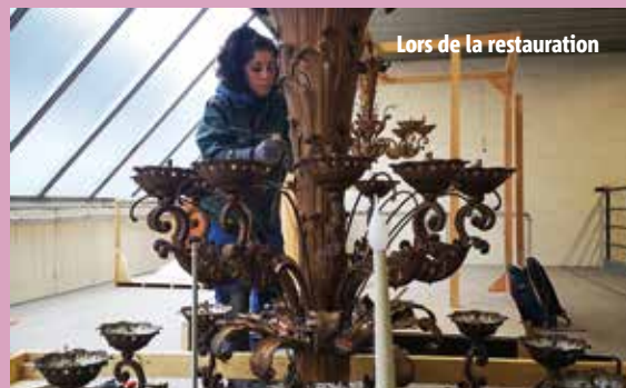
Lors de la restauration