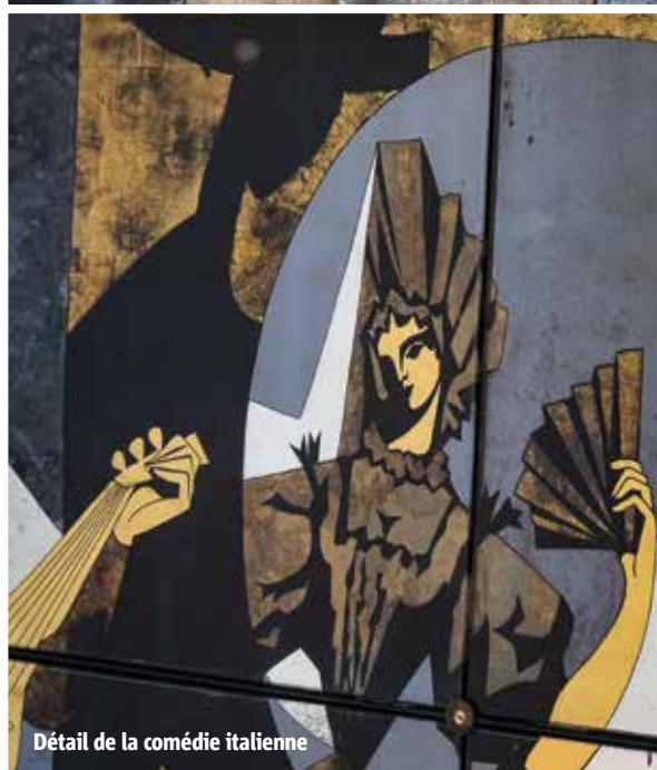
Détail de la comédie italienne