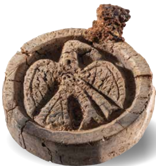
Un pion à peu plus large qu'une pièce de 2 € et figurant un oiseau.

À Poitiers, quand on creuse, on trouve. Dans cette série dédiée aux fouilles, Poitiers Mag met en lumière les trésors découverts lors des fouilles réalisées au fil des siècles. Ce mois-ci : un pion de jeu en bois (corne) de cervidé.