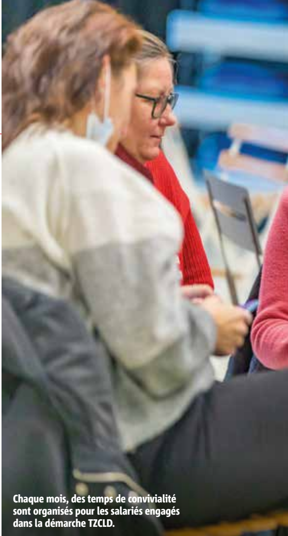
Chaque mois, des temps de convivialité sont organisés pour les salariés engagés dans la démarche TZCLD.