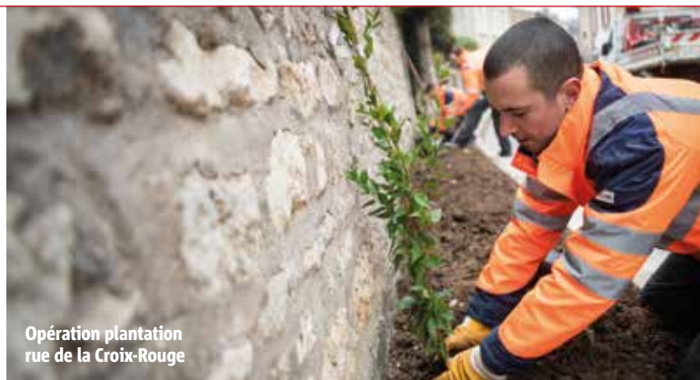
Opération plantation rue de la Croix-Rouge