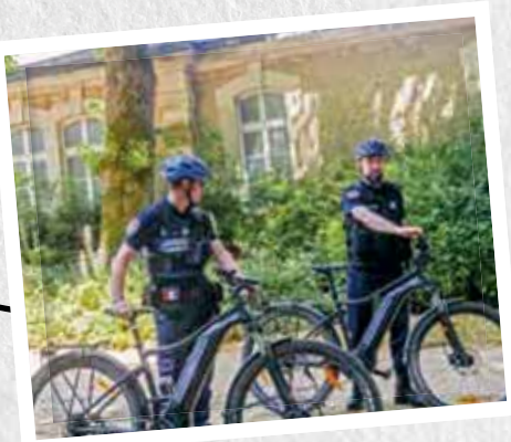
Les policiers peuvent se déplacer à vélo, en voiture, à moto ou simplement à pied.