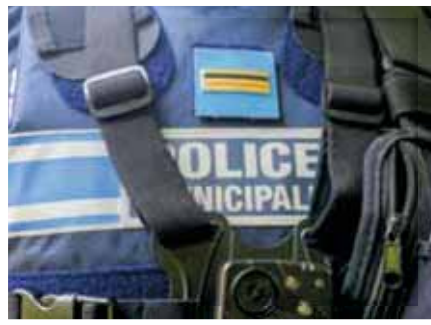
Chaque policier a son grade sur la poitrine. Dans l'ordre, il y a gardien, brigadier, brigadier-chef principal et chef de service. Une formation de 3 à 6 mois permet de devenir policier municipal.