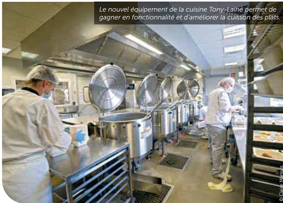
Le nouvel équipement de la cuisine Tony-Lainé permet de gagner en fonctionnalité et d'améliorer la cuisson des plats.