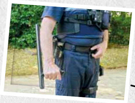
Le tonfa, sur la photo, sert à se protéger le bras et le visage. Un policier est également équipé d'un gilet pare-balle, d'une radio, d'une matraque télescopique, d'une bombe lacrymogène et d'un PVE (procès-verbal électronique).