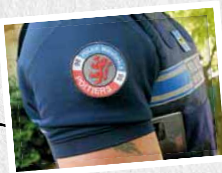
Les policiers municipaux, contrairement aux policiers nationaux, ne peuvent pas mettre des personnes en garde à vue, arrêter un criminel ou mener des enquêtes. Le chef des policiers nationaux est le ministre de l'Intérieur et la cheffe des policiers municipaux est la maire de Poitiers.