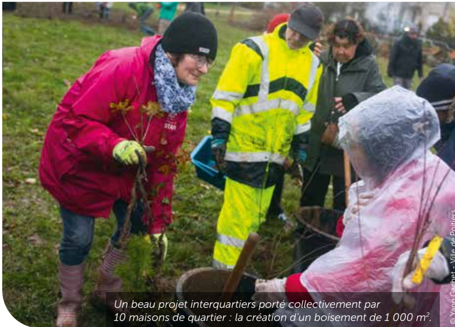
Un beau projet interquartiers porté collectivement par 10 maisons de quartier : la création d'un boisement de 1 000 m 2 .